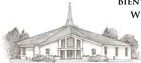
HOLY FAMILY CHURCH