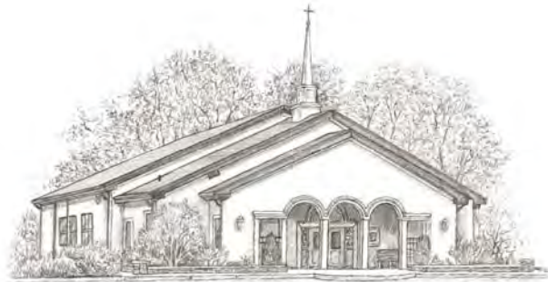
ST. ANTHONY CLARET